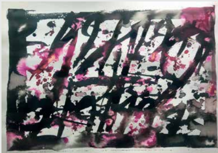
Έργο - ευγενική προσφορά του σπουδαίου Σαλονικιού εικαστικού Σάμη Ταμπάχ, εμπνευσμένο από το Ολοκαύτωμα του Χορτιάτη